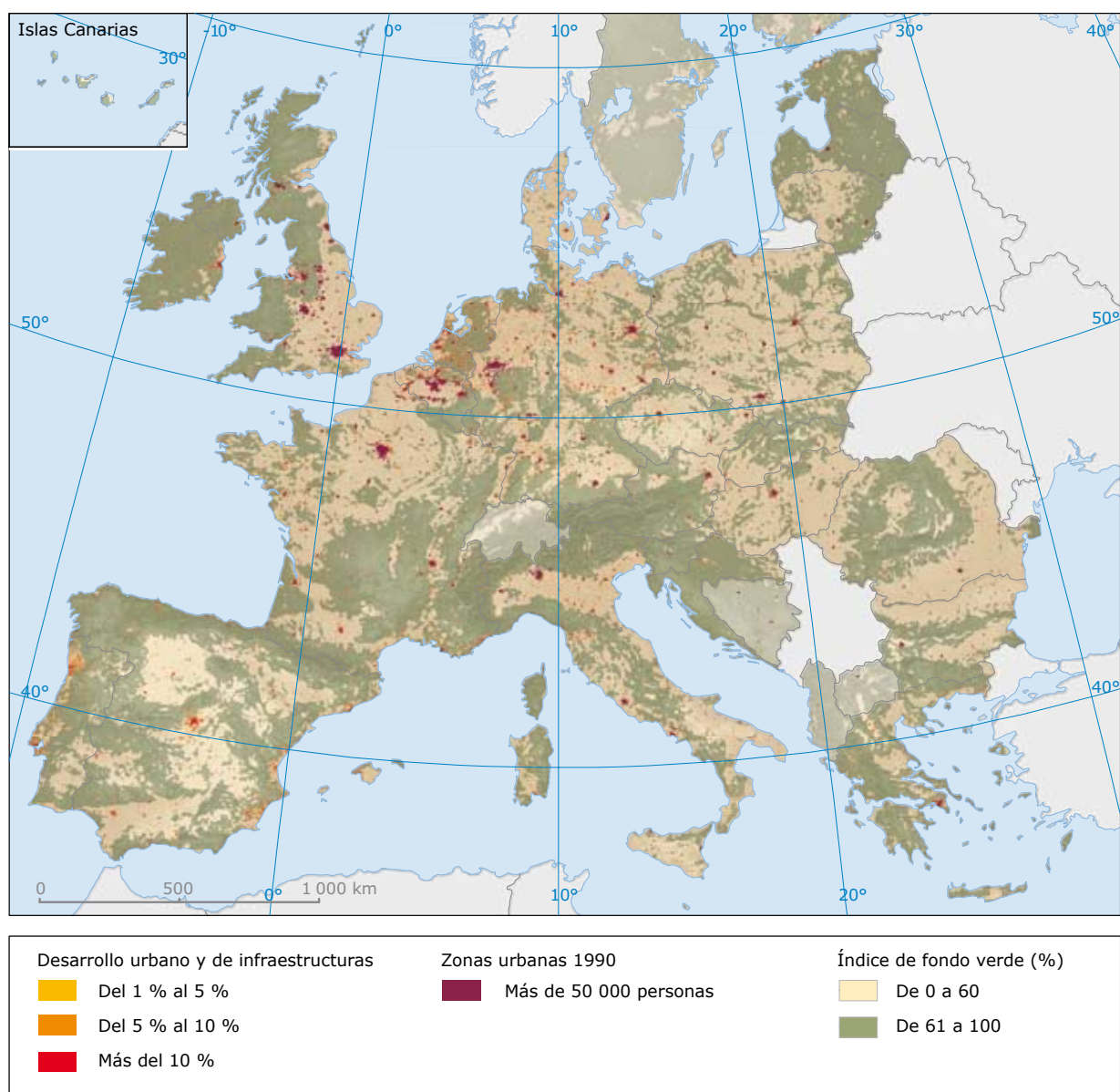
Figura 1 Expansión de las zonas urbanas y desarrollo de otras superficies terrestres artificiales, 1990–2000